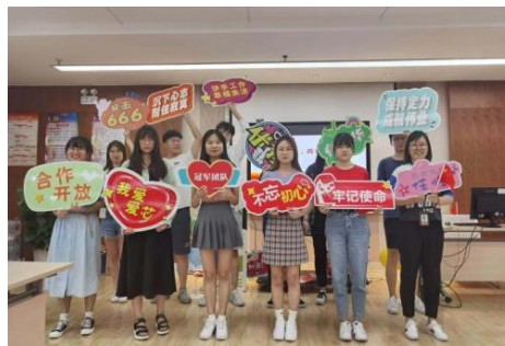
激情唱响祖国颂歌