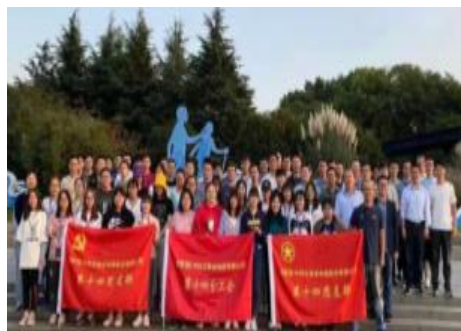
环蠡湖徒步健康行